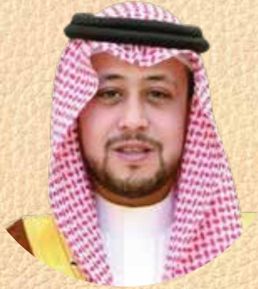
صاحب السمو الملكي الأمير فهد بن تركي بن فيصل بن تركي بن عبد العزيز آل سعود نائب أمير منطقة القصيم