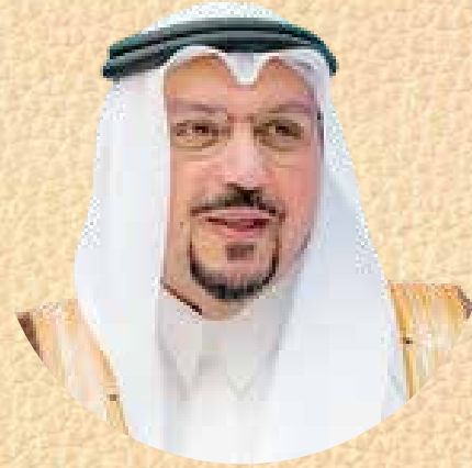
صاحب السمو الملكي الأمير الدكتور فيصل بن مشعل بن سعود بن عبد العزيز آل سعود أمير منطقة القصيم